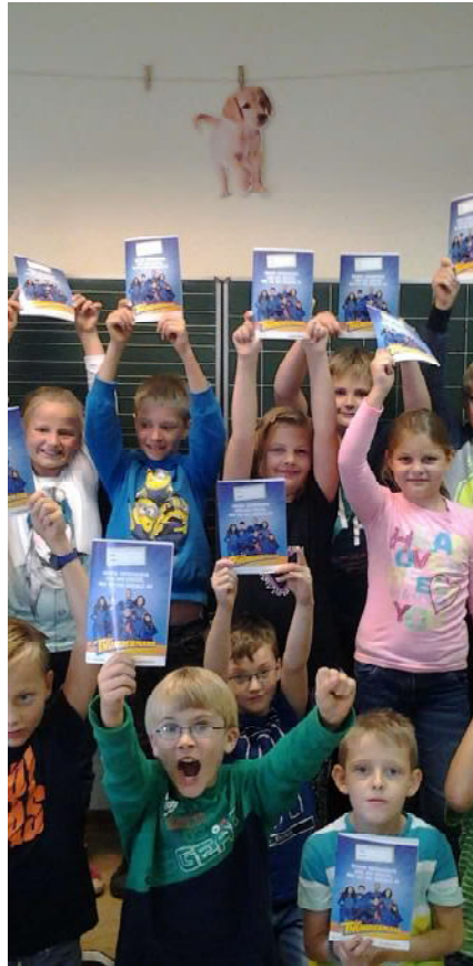
Schulheft / busybook