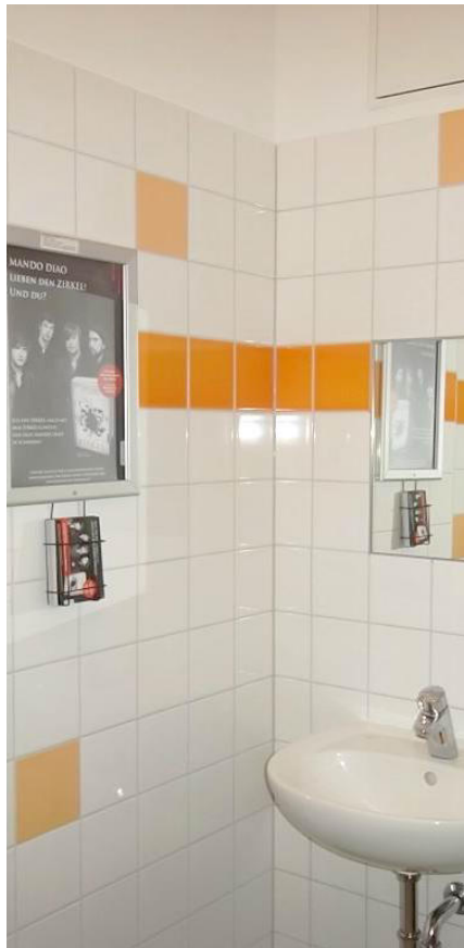
WC-Poster / girlboard