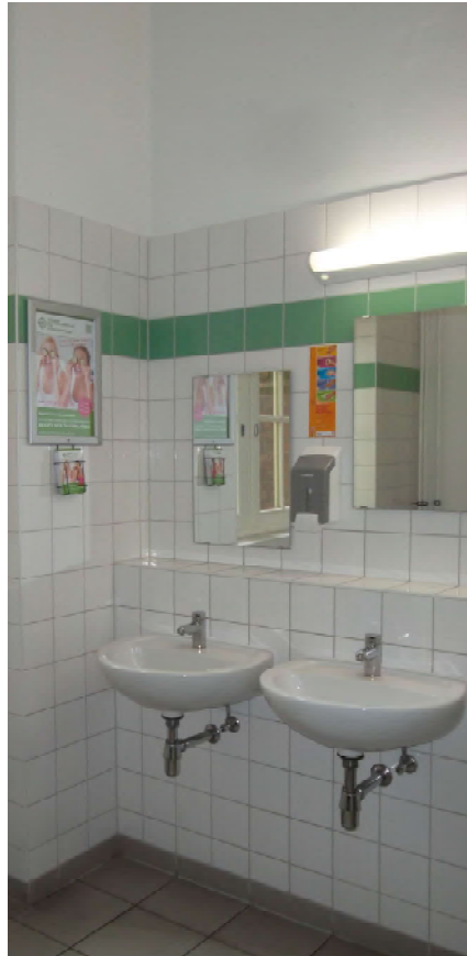
WC-Poster / girlboard